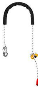
GRILLON HOOK Europska verzija