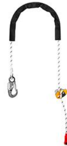
GRILLON HOOK Internacionalna verzija