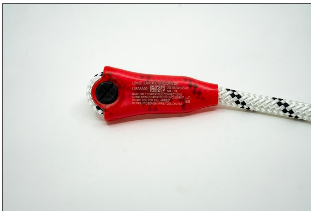
Oznaka na plastičnom omotu slobodnog užeta

Ako Vaš proizvod ima "oznaku na etiketi", nije obuhvaćen ovim zahtjevom za inspekciju.